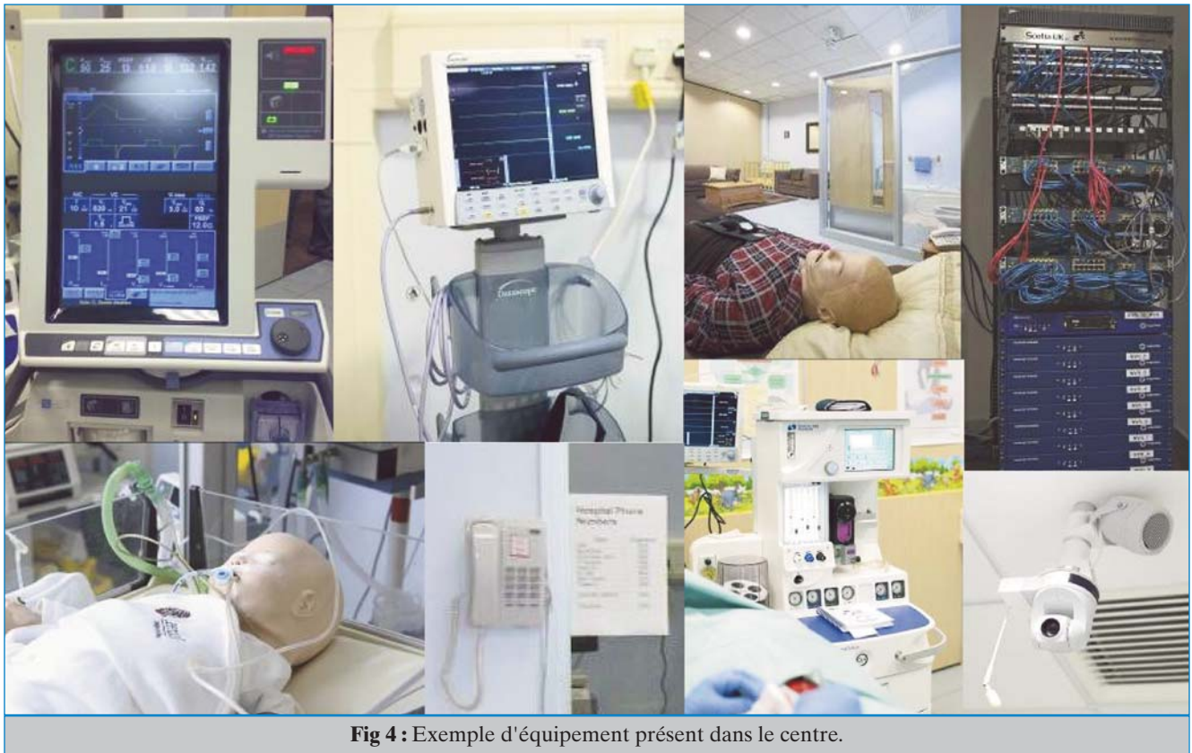
Fig 4 : Exemple d'équipement présent dans le centre.

installées sur un réseau (figure 1) et totalement équipé (figure 4). C'est le plus grand centre développé pour la simulation de haute fidélité en Grande-Bretagne et attire de nombreux visiteurs.