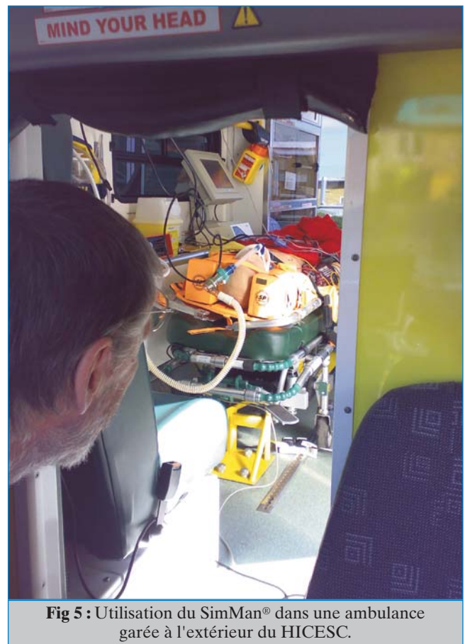
Fig 5 : Utilisation du SimMan® dans une ambulance garée à l'extérieur du HICESC.

Le centre est dédié à la simulation médicale de haute fidélité avec des étudiants de nombreuses disciplines comme l'illustrent les figures 2 et 5, mais d'autres sessions y prennent place tout aussi régulièrement. Les sessions de simulation organisées par le centre même sont souvent couplées avec un élément de recherche afin d'étudier l'impact sur l'apprentissage des participants ou tout autre aspect de ce qui se produit pendant les scénarios et les débriefings.