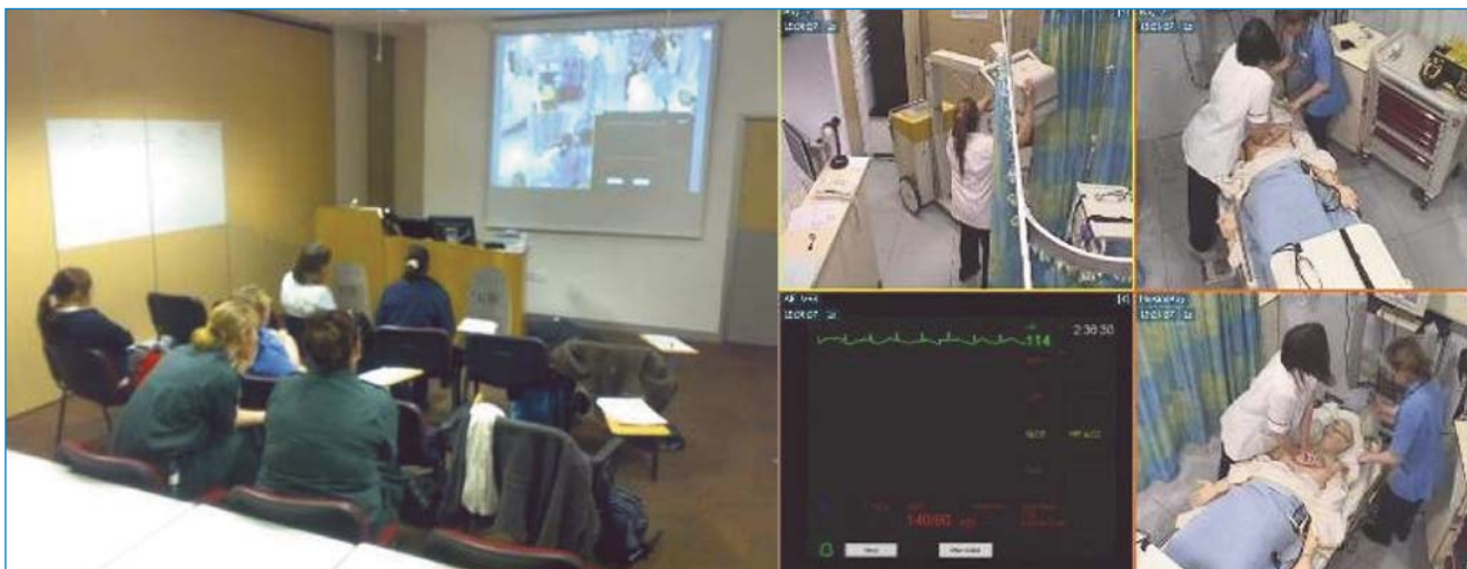
Fig 2 : Vue de l'une des salles d'observation de HICESC et capture de quatre caméras au travers du système SMOTS (de Scotia UK plc).

Le centre est aussi régulièrement utilisé par les hôpitaux locaux pour des formations spécialisées des docteurs en anesthésie ou en obstétrique. Dans la plupart des cas, les