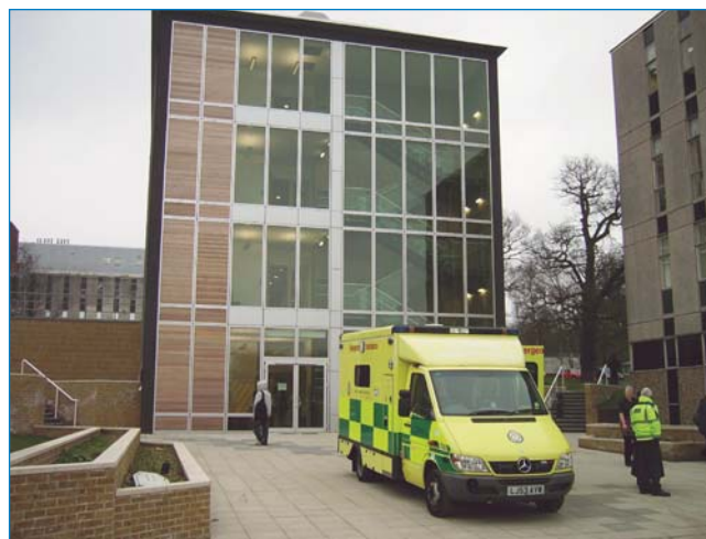
Fig 3 : Le nouveau bâtiment de la Faculté de Santé et des Sciences Humaines.

Le nouveau centre ouvrit ses portes en 2006 (figure 3) et commença rapidement à devenir un atout de plus en plus apprécié à plusieurs niveaux au sein de l'Université. Ce nouveau centre, à vocation multidisciplinaire, comprend une pharmacie, une salle de soins intensifs adulte et pédiatrique qui peuvent se transformer en salles d'opération, une salle des urgences pour 4 patients, un studio aménagé avec salle de bain, une salle informatique et 3 salles d'observation, le tout desservi par un système SMOTS® de 26 caméras